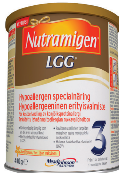
Nutramigen 3 LGG® Från 1 år och framåt med vaniljsmak

Vill du ha flera råd eller har du frågor om våra produkter? Kontakta gärna vår kundtjänst på telefon: 08-586 33 500 mellan kl 9-15 vardagar eller email: nutrition@abigo.se