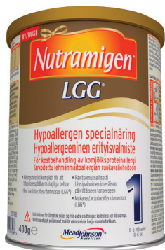
Nutramigen 1 LGG® Från födseln till 6 månader

Åldersanpassad kostbehandling av komjölsallergi