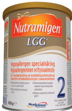
Nutramigen 2 LGG® Från 6 månader och framåt